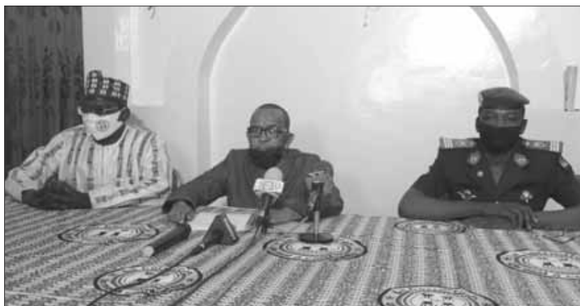
Le bureau de la HALCIA lors d'une déclaration

La mise en œuvre de ces dispositions a eu un impact positif sur le déroulement du processus électoral. En effet, de façon générale l'Observa-