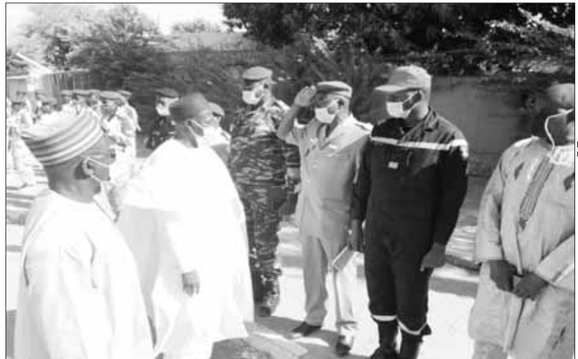
Le nouveau gouverneur salué par les responsables régionaux