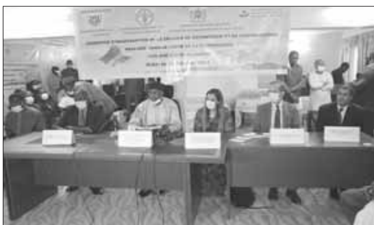
Lors de la cérémonie de lancement ...