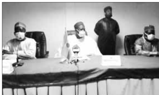
Réunion de prise de contact

rendu hommage à feu Issaka Assane qu'il a qualifié "d'homme intègre et affable" doté "d'un sens