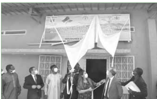
Issa Moussa / ONEP