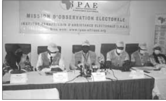
Les membres de la mission électorale de l'IPAE

La mission de l'IPAE a, en outre, apprécié le bon établissement du fichier électoral en ordre alphabétique ; le calme, la discipline et le civisme des électeurs observés ; la forte participation des femmes et des jeunes au scrutin ; la présence ef-