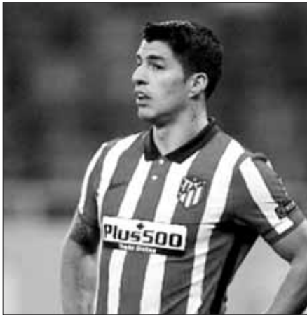
Le Joueur Luis Suarez d'Athlético Madrid

le blason du football espagnol, mercredi, à l'occasion de son déplacement sur la pelouse de l'Atalanta Bergame. Passé proche d'une élimination historique dès la phase de poules, le club madrilène n'en est pas moins sorti en tête de son groupe et aura donc l'avantage