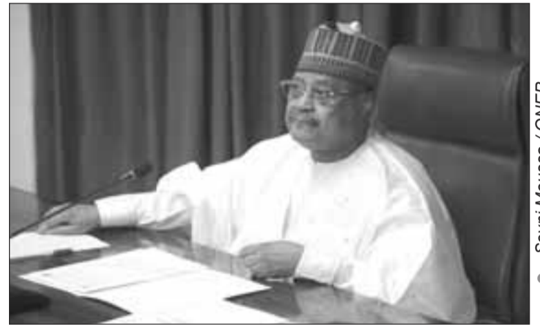
Le président de l'Assemblée nationale lors de la réunion