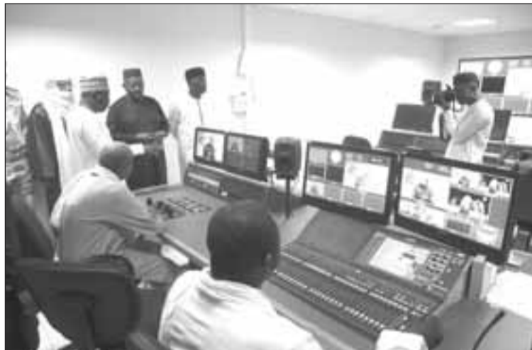
Le ministre de la Communication visitant la RTN