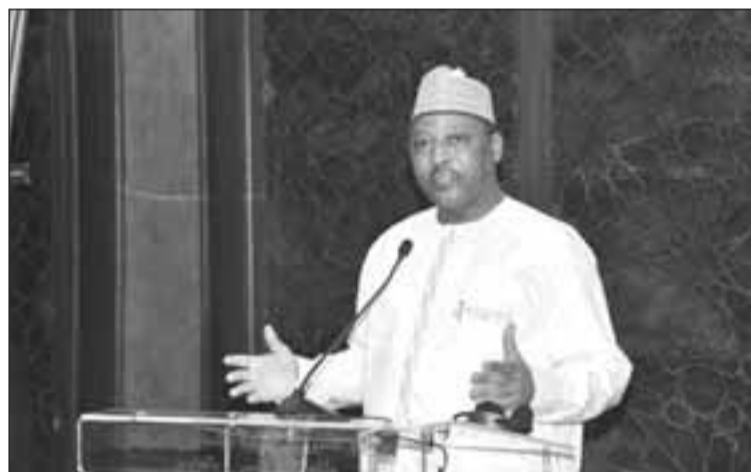
Le ministre Hassoumi Massoudou prononçant son discours

Pour les pays de la région du Sahel central et du Bassin du lac Tchad, a dit M. Hassoumi Massoudou, les actions de ces groupes armés terroristes sont venues perturber sérieusement la paix et la stabilité de tous. Notant que la menace sécuritaire dont souffrent les populations sahéniennes leur a été imposée. M. Hassoumi Massoudou a estimé que cette situation ne doit pas être seulement une problématique locale mais une préoccupation de portée globale qui requiert