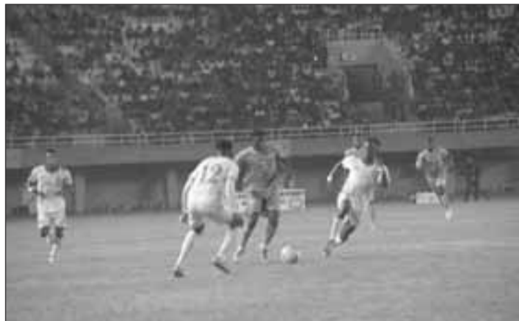
Une séquence du match Bénin VS Niger

Le tournoi qualificatif pour la CAN U20 de la zone UFOAB se poursuit au stade Général Seini Kountché de Niamey. Le mardi 10 mai 2022, la poule A, a joué sa deuxième journée dans cette compétition. Le classement provisoire dans cette poule donne la Côte d'Ivoire en tête avec 6 points (deux victoires), le Bénin deuxième avec 4 points, le Niger troisième avec 1 point et le Togo quatrième avec zéro point (deux défaites). Ainsi, la troisième et dernière journée qui se tiendra demain 13 mai sera très déterminante. Elle permettra de déterminer le classement général, mais aussi, le deuxième qualifié de la poule, entre le Niger et le Bénin.