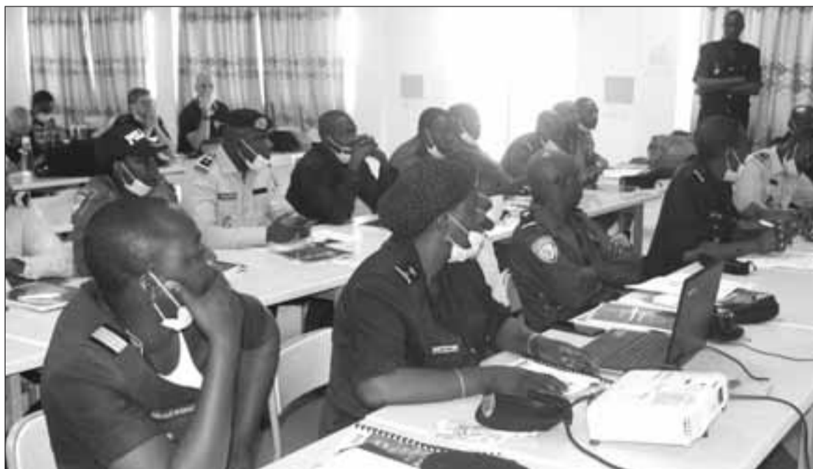
Lors d'une formation des corps de la Police et la Gendarmerie

L'Equipe Conjointe d'Investigation (ECI-Niger) a été créée à la fin de l'année 2016 et regroupe en son sein des fonctionnaires de la police du Niger, de France et d'Espagne. Elle constitue une des réponses alternatives du Niger et de ses partenaires dont l'Union Européenne (UE), qui finance l'action, aux flux migratoires irréguliers et enjeux connexes. Il s'agissait pour les autorités nigériennes de doter le pays d'un modèle solide et très efficace de coopération policière pour lutter contre les réseaux criminels liés à la traite des êtres humains, au trafic illicite de migrants et à la fraude documentaire.