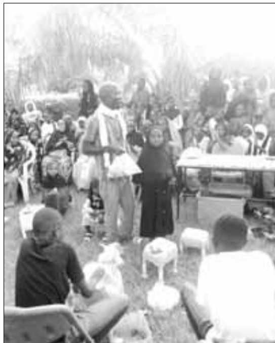
... comment recycler les déchets plastiques

tour de nous, il y'a beaucoup de déchets, beaucoup d'objet rejetés après l'usage du départ. Mon imagination m'a amené à comprendre que ces objets qui constituent des déchets autour de nous peuvent aussi être transformés pour d'autres choses utiles. Je n'ai pas appris ce travail avec quelqu'un. Je pense que c'est un don de Dieu. Et j'ai décidé de partager cette connaissance avec les jeunes, notamment les élèves du primaire. J'étais parti voir l'inspectrice de l'enseignement primaire communal Niamey 10 pour une collaboration avec les écoles de son entité. Dieu merci, j'ai eu une bonne écoute et nous sommes entendus. Aujourd'hui c'est le fruit de cette collaboration que nous