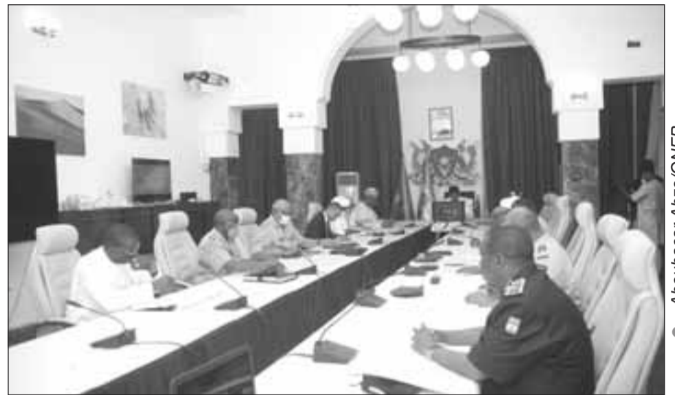
Lors de la réunion du Conseil national de sécurité

ment ainsi que des hauts responsables des Forces de défense et de sécurité. Le CNS assiste le Chef de l'Etat et donne des avis sur les questions relatives à la sécurité de la Nation, à la défense du territoire, à la politique étrangère et de manière générale sur toutes questions liées aux intérêts vitaux et stratégiques du pays.