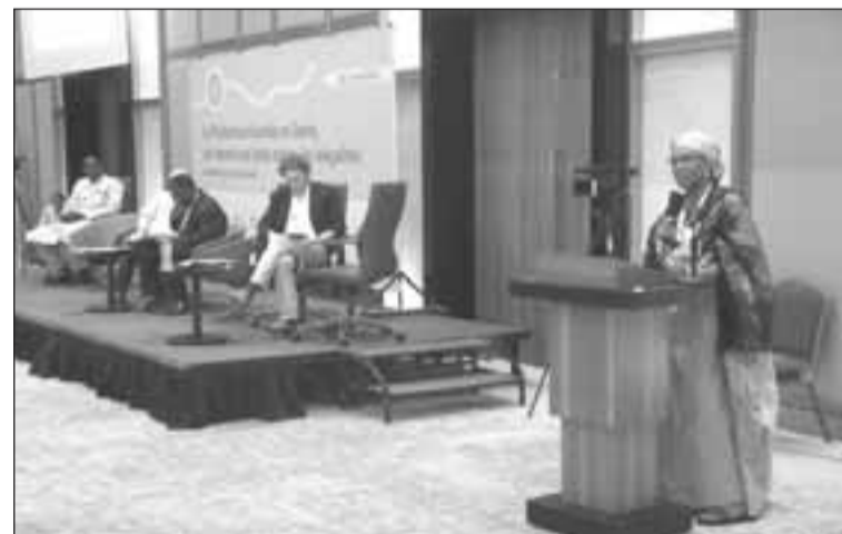
Lors d'un panel hier

La Conférence est unanime qu'avant tout, il faudra instaurer une gestion professionnelle des programmes et mutuelles du secteur de la protection sociale en santé. Ce qui fait aussi dire à un membre de la délégation ougandaise que la prévention doit être un composant important des politiques de protection sociale en santé. D'où son appel pressant à mettre un terme aux faux diagnostics et les longs traitements qu'ils induisent inutilement, des fac-