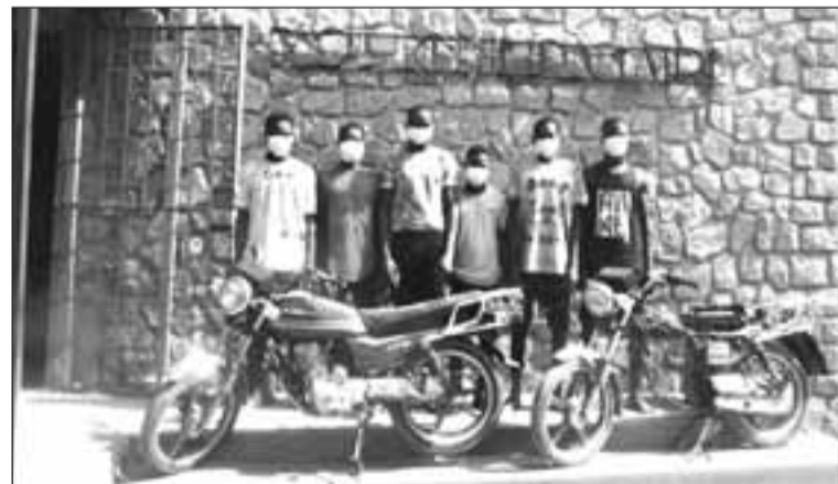
Une vue des malfaiteurs présentés à la PJ

interpellée. Quant à la seconde bande, qui opère généralement dans les quartiers sus cités, elle a, à son actif, plusieurs vols de nuit en réunion, avec violences et armes blanches (couteaux et machettes etc.). «Ils ont fait plusieurs victimes dont deux porteurs de tenue parmi lesquels un est actuellement hospitalisé suite aux blessures graves qu'ils lui ont occasionnées», précise la