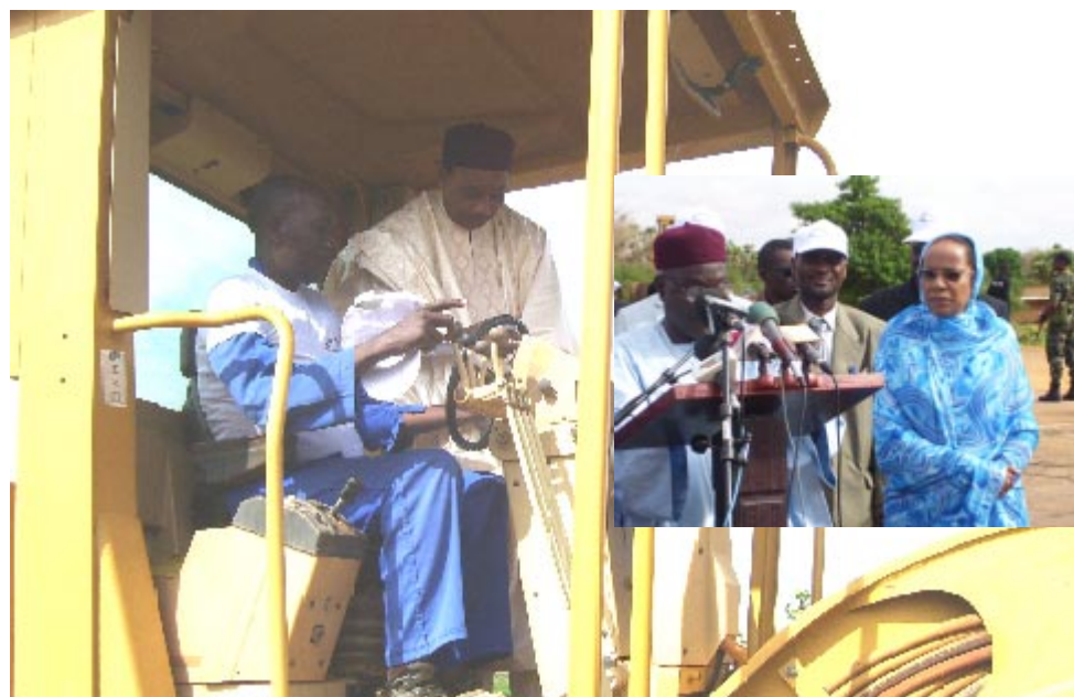
Le Président de la République donnant le coup d'envoi des travaux